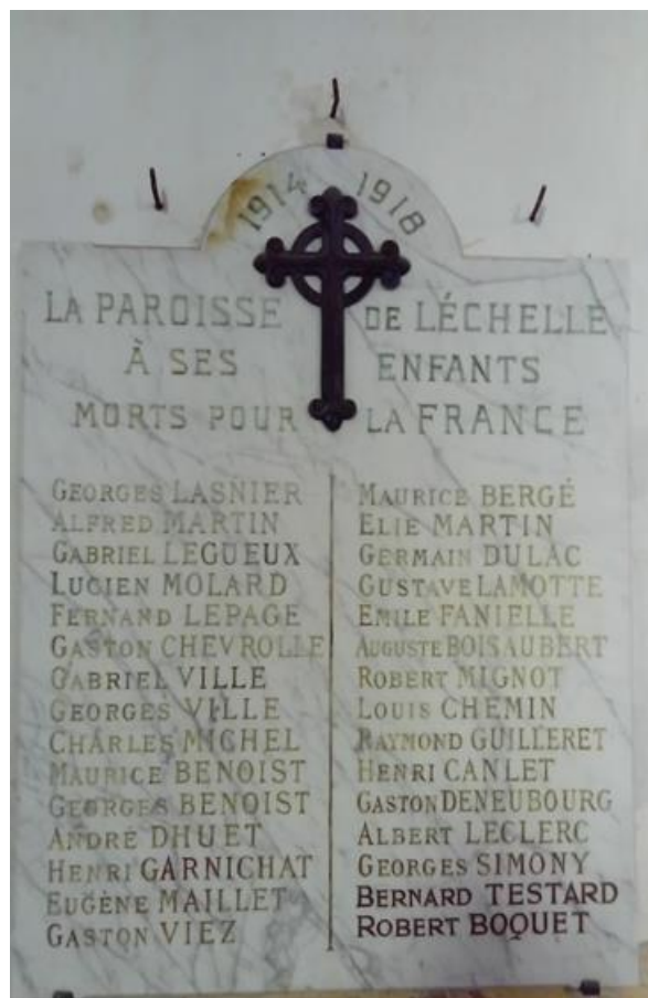
Plaque commémorative à l'église de Léchelle

Lors de la cérémonie du 11 novembre, les enseignants, quelques enfants et des habitants étaient présents pour chanter la Marseillaise et ainsi commémorer le 100 ème anniversaire de la fin de la guerre 1914-1918.